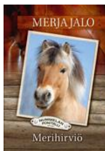
Jalo Merja, Merihirviö

Kiitetyn ja palkitun fantasiatrilogian päätösosa lumoa kauneudellaan ja herkkävaistoisuudellaan. Ennen kaikkea se on väkevä tarina rakkaudesta: sen jatkuvuudesta, pysyvyydestä ja katoavuudesta.